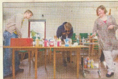
Hver tirsdag eftermiddag maler eleverne på Nødebogård til musik i billedkunstværkstedet på hjemmets skole.